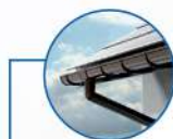
PVC Улуци INES / BRYZA