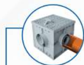
Универсални шахти Shaft-Line