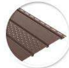
Обшивка за стрехи Soffit