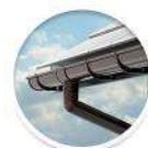
PVC улици INES