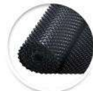
Хидроизолация PDM 400