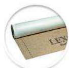
Паро-пропусклива покривна мембрана Roof-Foil