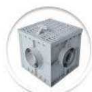
Универсални шахти Shaft-Line

Разгледайте и останалите продукти онлайн на www.lexon.bg