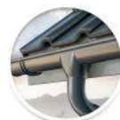
Метални улици Roof-Stal