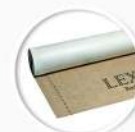
Паро-пропусклива покривна мембрана Roof-Foil