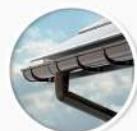
Система PVC улици INES Roof-Drain