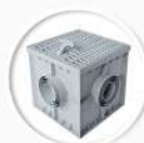
Универсални шахти Shaft-Line