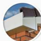
Челни дъски Roof-Line